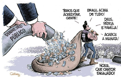
Imagem nº 2 e 3: Charge de Quinho e Fraga

relação entre o sertanejo e os políticos de extrema-direita, personificada, naquele momento, na figura de Jair Bolsonaro (Intercept Brasil, 04 jun. 2022). De fato, quando “O Embaixador” se viu encurralado, tentou comover o público por meio das redes sociais e instrumentalizar sua trajetória de menino humilde ao hall da fama, ao melhor estilo self-made man 191 . Além disso, quem também o consolou naquele momento foi ninguém menos que o senador Flávio Bolsonaro, filho do então presidente da república de sobrenome homônimo que lutava desesperadamente pela reeleição (Poder360, 31 mai. 2022). Ressalta-se que Lima era declaradamente um apoiador importante do presidente em funções e candidato à reeleição.